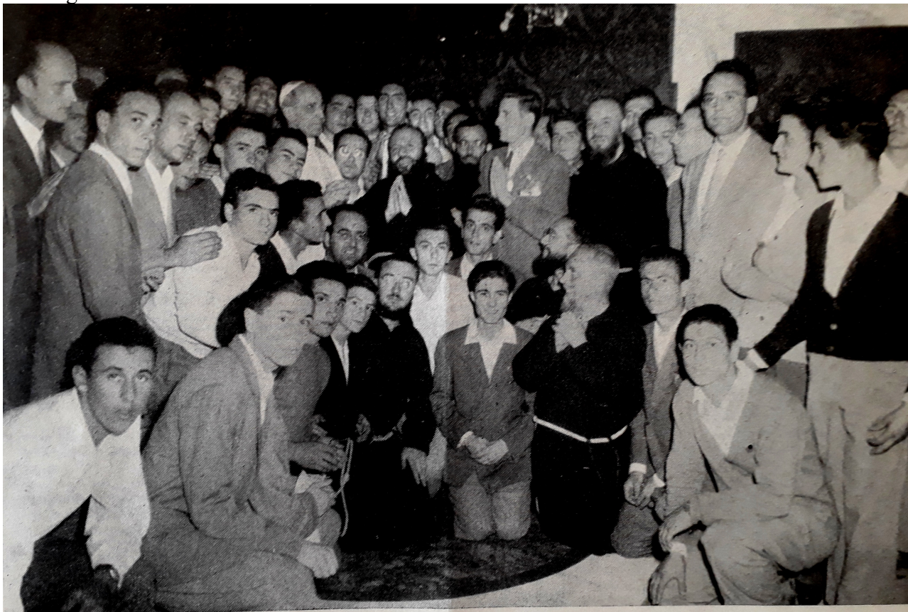
La memorabile Udienda privata concessa da Sua Santità Pio XII il 19 agosto 1951 ai nostri giovani durante il Convegno Nazionale presso Albano, Udienda che fu definita la « Confermazione » della Gioventù Franciscana

Gioventù Franciscana che ebbe il suo "battesimo" presso il Papa Pio XII nell'udienza concessa ai giovani terziari di Montughi che gli presentarono la loro rivista "Il Colle" e la sua "confermazione" il 19 Agosto 1951.